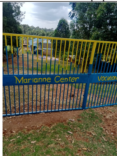
Wij zijn weer klaar om open te gaan!