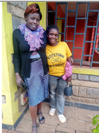
Een van onze studenten staat te popelen om weer te beginnen!