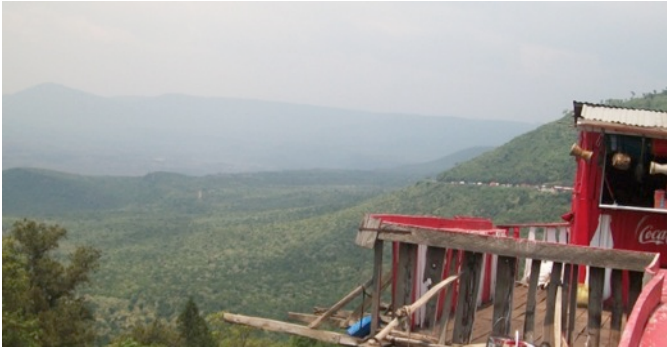
Great Rift Valley View Point

Onderweg komen de studenten in contact met andere mensen. Begroetingen door onze studenten worden aangemoedigd. Het personeel maakt altijd van de gelegenheid gebruik om met de mensen over onze activiteiten te praten. Deze interactie is erg belangrijk, want hierdoor komt Marianne Center onder de aandacht van de lokale bevolking en wordt er bewustwording gecreëerd over de potenties van mensen met een verstandelijke beperking.