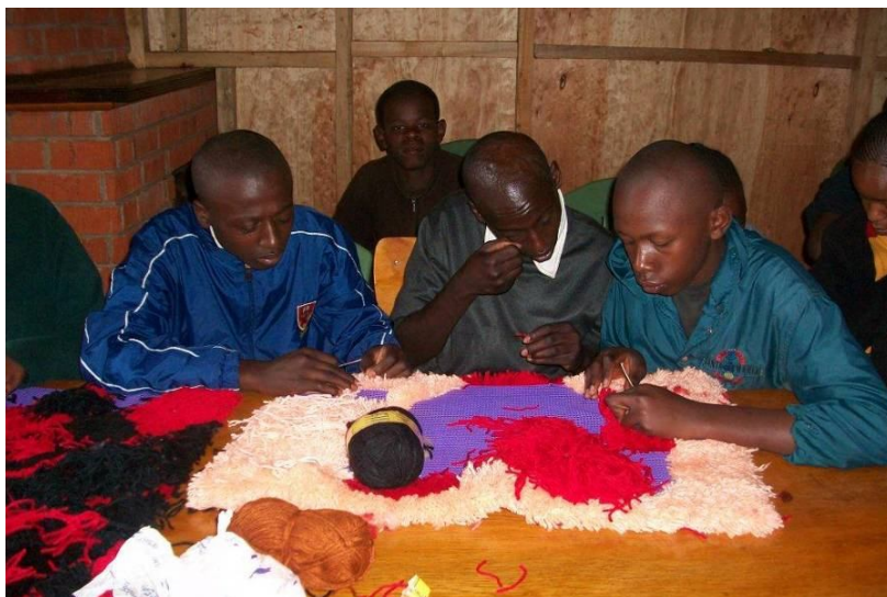
De studenten maken een vloerkleed

In dit afgelopen jaar hebben wij de activiteiten van 2010 tuinieren, persoonlijke hygiëne, koken, naaien, huishoudelijke activiteiten, agrarische activiteiten, dierhouderij, computerles en handwerken voortgezet. Nieuwe activiteiten die wij hebben aangeboden dit jaar waren zeep en kleden maken. Computerles en naailes zijn uitgebreid omdat vanaf volgend jaar een aantal van onze studenten hun eerste examen gaan doen in deze activiteiten. Vanaf januari 2012 zullen wij in al onze activiteiten toewerken naar het eindexamen en de studenten die de vaardigheden beheersen het examen aan het eind van het jaar laten afnemen.