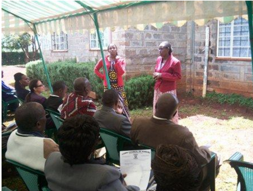
Speeches gedaan door diverse organisaties tijdens de open dag

Onze studenten lieten hun talenten zien door zang en dans en hun producten werden tentoongesteld en deels verkocht. Dit event heeft voor meer naamsbekendheid gezorgd en wij hopen dat dit bijdraagt aan het netwerken en fondsenwerven in Kenia.