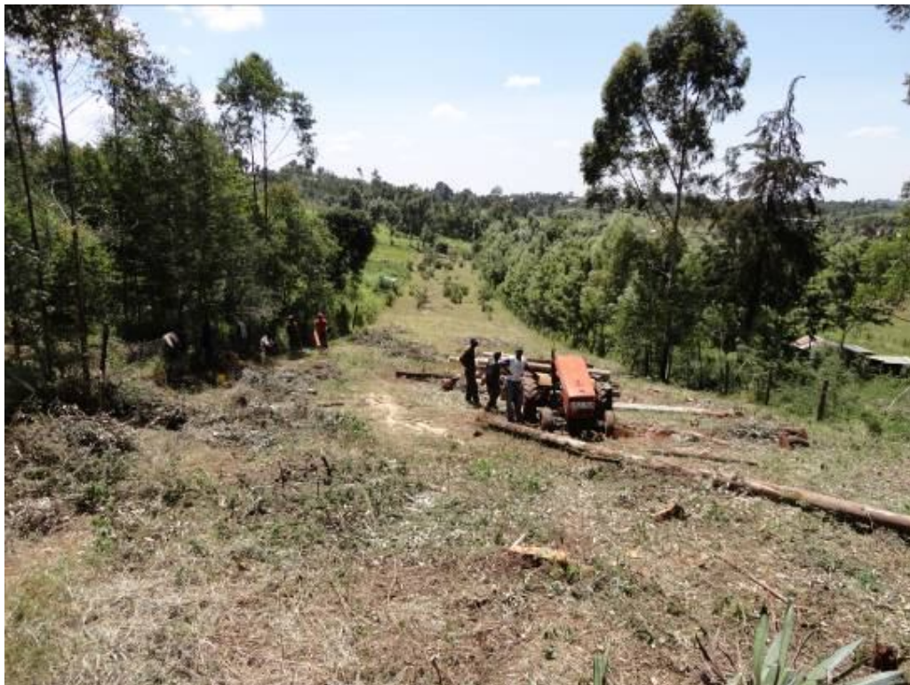
Land wat Marianne Center Foundation in Kenia aangekocht heeft

In december zijn wij de trotse eigenaar geworden van een stuk grond (0.6 hectare) waarop wij willen gaan starten met de bouw van onze eigen locatie. Dit land bevindt zich in dezelfde omgeving als waar Marianne Center momenteel gelegen is. Wij hebben de mogelijkheid tot eventuele uitbreiding in de toekomst en deze locatie is beter bereikbaar dan de huidige. Om Marianne Center meer financieel onafhankelijk te maken is het hebben van een eigen locatie van belang. Hierdoor valt een groot deel van de vaste lasten weg doordat de huur (die elk jaar met 10% verhoogd wordt) niet meer bekostigd hoeft te worden. Ook bestaat er geen risico meer dat de huiseigenaar andere huurders vindt die meer betalen en ons er zonder pardon uit kan zetten. In 2012 hopen wij voldoende sponsoren te vinden die bij willen dragen aan de bouw van een nieuw centrum en daarmee bijdragen aan de onafhankelijkheid en de voortzetting van de activiteiten van Marianne Center. De plannen en bouwtekeningen worden op dit moment ontwikkeld wat zal helpen in het fondsenwerven lokaal en internationaal.