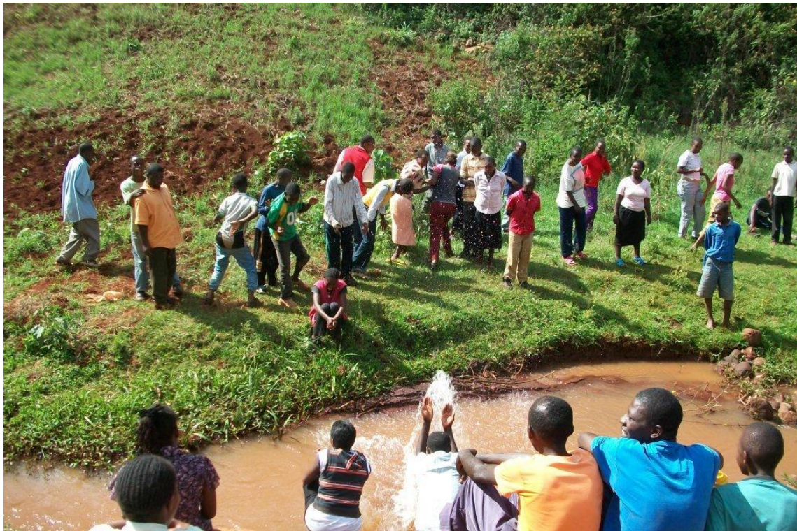
De studenten genieten van een pauze tijdens de vrijdagmiddagwandeling

In oktober is er door ons personeel, in samenwerking met andere organisaties, een mini-olympics georganiseerd. Tijdens dit event deden blinden, doven, verstandelijk en lichamelijk gehandicapten mee. Iedereen was een winnaar en kreeg daarom ook een 'Certificate of Achievement'. Het was zelfs zo geslaagd dat wij amper onze studenten in de bus kregen terug naar Marianne Center.