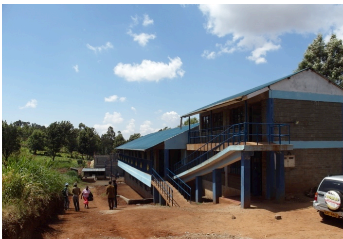
Slaapzalen en klaslokalencomplex

Begin januari waren begonnen met de voortzetting van de bouw, met behulp van de ontvangen giften van onder andere Wilde Ganzen. Het klaslokalen- en slaapzalencentrum is volledig afgerond. De keuken en eetzaal/workshop is bijna in gebruik en de muren zijn geplaatst voor de kantoren. Helaas hebben wij het niet volledig kunnen afronden, omdat de bouwtekeningen zijn aangepast zodat de bakkerij in eigen locatie kan gerealiseerd worden. Daarnaast zijn de bouwrijzen verhoogd en koersen in ons nadeel omhoog geschoten. Daardoor kon de bouw niet volledig afgerond worden. Wij verwachten dat lokale bedrijven en sponsors het laatste deel van de bouw zullen gaan afronden.