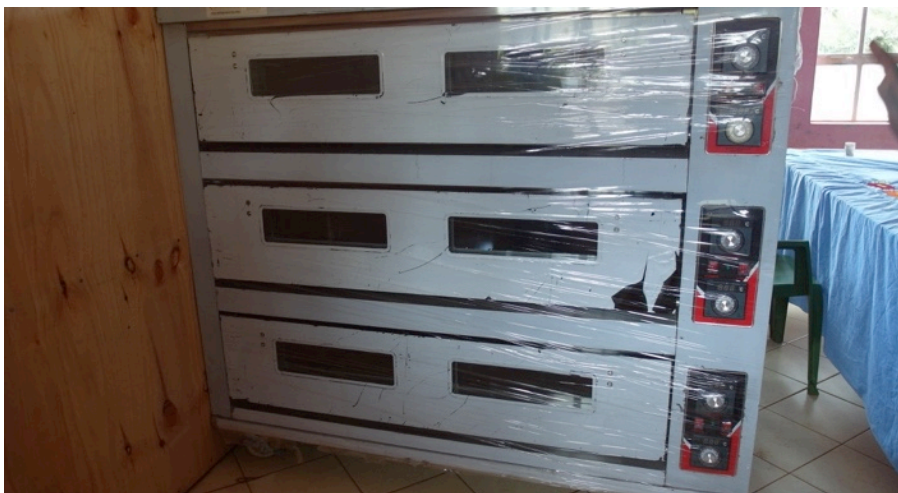
De oven, bijna klaar voor gebruik

Met behulp van een brommertje kan ook op bestelling aan huis/winkel/school geleverd worden. We hopen bakproducten te verkopen aan winkeltjes (kiosken), huishoudens en scholen.