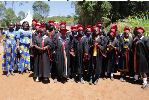
De afgestudeerde studenten

Op 9 november zijn 26 van onze studenten afgestudeerd, 11 jongens en 15 meiden. De afgestudeerde studenten zullen begeleid worden in het proces van integratie in de maatschappij. Op dit moment hebben 16 studenten al werk. Een van de studenten, zoals u hieronder kunt lezen, is aangenomen als een van onze leraren. Andere studenten hebben werk gevonden (voor een werkgever of eigen bedrijfje) in; een kapsalon, als beveiliging, in een bakkerij, naaiatelier, catering, huishouding, boerderijwerk, bouw, als schoonmaakster en vanuit huis sieraden maken. Voor de andere studenten zijn wij nog met werkgevers en ouders in overleg.