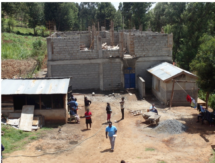
Keuken, eetzaal en administratiegebouw