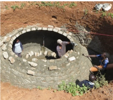
Bouw van de biogasinstallatie

De organisatie SACDEP heeft ons gesteund in het opzetten van een biogasinstallatie. De installatie is nog niet volledig afgerond. Dagelijks zullen er zo'n twee kruitwagens aan koeienmest nodig zijn om voldoende gas te produceren. Daar zullen onze twee koeien voor moeten gaan zorgen en eventueel kunnen wij van de boeren in de buurt meer mest krijgen. De biogasinstallatie zal gas produceren dat gebruikt kan worden om voor zo'n 400 mensen per dag te kunnen koken. Aangezien dat voor ons nog niet nodig is, zullen wij een biogas-generator aanschaffen om het overtollig gas om te zetten naar elektriciteit. Dit zal alleen niet voldoende zijn om alle gebouwen te voorzien van elektriciteit en daarom zijn wij nu in gesprek met een organisatie om ons zonnepanelen te verschaffen.