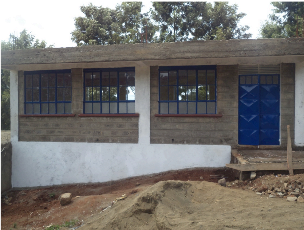
Bouw van het eerste gedeelte van het klaslokalencomplex

De crisistijden hebben helaas ook effect op Marianne Center en haar programma's. Onze plannen voor de verstandelijk beperkte studenten zijn veelbelovend, maar om financieel zelfredzaam te worden moeten er eerst investeringen gedaan worden om dit te kunnen bewerkstelligen. Investeringen voor bijvoorbeeld de bouw en inkomens genererende activiteiten, zoals de kippenhouderij, zullen enorm bijdragen aan de zelfredzaamheid van Marianne Center. Door het langzaam vrijkomen van financiën zal deze doelstelling vermoedelijk later bereikt gaan worden dan gepland is. Desalniettemin kunnen wij nog steeds de verstandelijk beperkte studenten de programma's, ondersteuning en zorg bieden die zij nodig hebben.