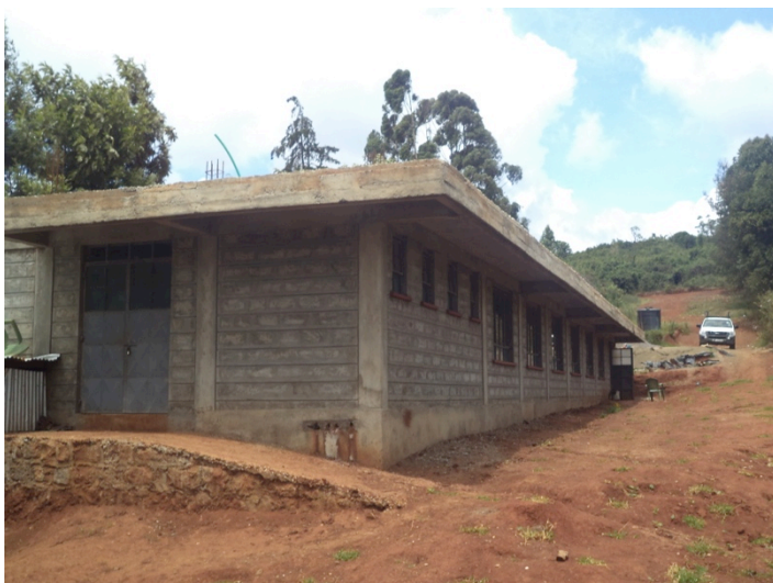
Bouw van de eerste slaapzaal van het slaapzalen- complex

Met de subsidies, giften en donaties hebben wij een eerste start kunnen maken met de bouw van Marianne Center. In mei hebben wij de bouw van onze eerste slaapzaal af kunnen ronden. We zijn erg dankbaar en blij voor de sponsors die de bouw van deze slaapzaal mogelijk hebben gemaakt. Er moeten nog enkele afwerkingen gaan plaatsvinden, zoals het verven van de binnen- en buitenmuren en het leggen van de vloertegels. Deze slaapzaal kan 48 studenten huisvesten en wordt door onze vrouwelijke studenten in gebruik genomen. De tweede slaapzaal zal voor onze mannelijke studenten zijn. Momenteel zijn wij hard op zoek naar sponsors die de bouw van deze tweede slaapzaal willen financieren.