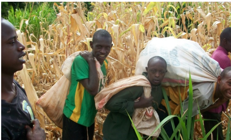
Mais oogsten van het land van Marianne Center

Dit jaar hadden wij de hoop dat 25 van onze studenten zouden gaan afstuderen. Vanwege de verhuizing naar onze nieuwe locatie heeft dit nog niet kunnen plaatsvinden. De verhuizing heeft voor vertraging gezorgd en daardoor konden wij de studenten niet voldoende voorbereiden op de examens. Wij verwachten dat de examens in 2013 gaan plaatsvinden. Omdat in 2013 de eerste studenten zullen gaan afstuderen leggen wij nu al contact met werkgevers om ze geïnteresseerd te maken om onze afgestudeerde studenten aan te nemen. Afhankelijk van de talenten en voorkeur van een student kan een bedrijfje aan huis beter passend zijn. In eerste instantie zullen studenten onder intensieve begeleiding staan en ondersteuning krijgen, maar als met de tijd taken routine worden en studenten meer zelfstandig kunnen werken zal deze ondersteuning langzamerhand uitgefaseerd worden.