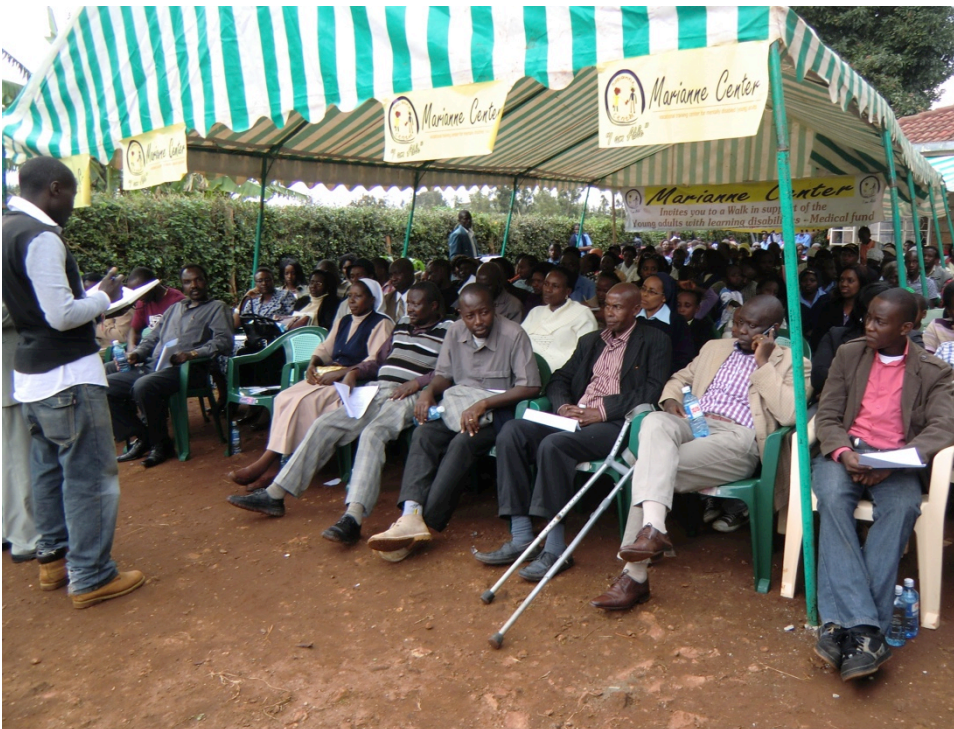
Vele bezoekers kwamen naar onze open dag

Om dit doel te bereiken hebben wij een aantal activiteiten georganiseerd dit jaar. In juni is er een open dag georganiseerd. Hierbij waren 250 mensen aanwezig. Onder de aanwezigen waren afgevaardigden van de gemeenteraad van Karuri en Limuru, journalisten van twee kranten en van een radioprogramma en afgevaardigden van de Anglicaanse kerk van Kenia en van diverse lokale organisaties (zoals Global Ethos) die zich inzetten voor mensen met een beperking. Alle aanwezige organisaties kregen de gelegenheid om te spreken en wederom werd Marianne Center door de aanwezigen geprezen voor haar goede en zeer belangrijke werk voor de verstandelijk beperkte mensen in Kenia. Onze studenten lieten hun talenten zien door zang en dans en hun producten werden tentoongesteld en deels verkocht. Dit event heeft voor meer naamsbekendheid en publiciteit gezorgd en wij hopen dat dit bijdraagt aan het netwerken en fondsenwerven in Kenia.