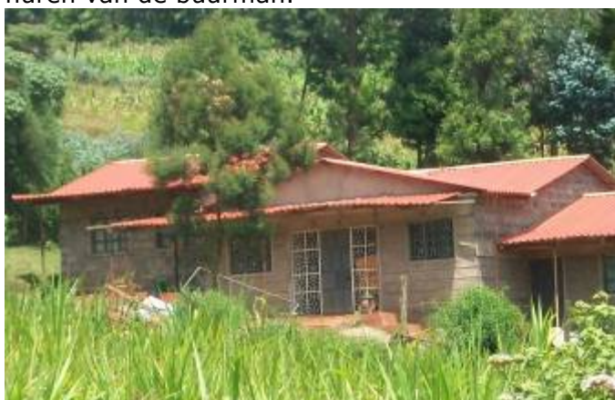
Het schooltje die wij tijdelijk huren

In december 2011 zijn wij de trotse eigenaar geworden van een stuk grond (0.6 hectare) waarop wij gestart zijn met de bouw van onze eigen locatie. Door middel van de door diverse sponsors ter beschikking gestelde subsidies en donaties konden wij de eerste stenen leggen. De eerste stenen zijn gelegd op 15 augustus. In september zijn wij om deze reden verhuist naar onze nieuwe locatie. Hierdoor hoeven wij de huur van bijna €1.000/maand niet meer te bekostigen en valt daarmee een grote last van ons af. In de tussentijd dat de bouw gaande is worden de studenten tijdelijk gehuisvest in het schooltje die wij voor €300/maand huren van de buurman.