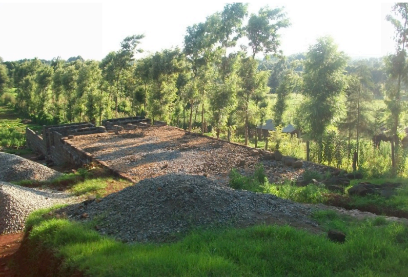
Fundering slaapzaal en klaslokaal

Met de subsidies, giften en donaties hebben wij een eerste start kunnen maken met de bouw van Marianne Center. Om ervoor te zorgen dat de beide gebouwen niet zouden instorten door de slechte ondergrond was een stevige fundering noodzakelijk. De fundering van de slaapzaal is hierdoor, en vanwege het enorme hoogteverschil, maar liefst 1.70 meter dik geworden. Helaas heeft deze fundering ons heel erg veel geld gekost, omdat een gewone fundering vanwege bovengenoemde redenen niet mogelijk was. Hierdoor heeft het bouwbedrijf alleen de funderingen van de slaapzaal en het klaslokaal kunnen leggen en een deel van de muren kunnen bouwen van de slaapzaal. Een andere donor heeft te kennen gegeven de bouw van de slaapzaal af te willen maken. Deze sterke funderingen geven ons wel het voordeel dat we omhoog kunnen bouwen, waardoor wij meer ruimte overhouden voor onze inkomensgenererende activiteiten, zoals kippenhouderij en de groentetuin.