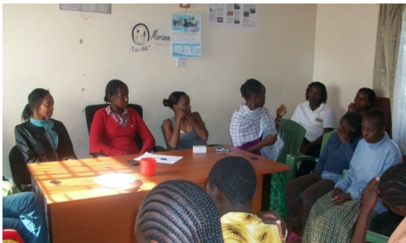
Tijdens de psychosociale sessies

in het bewustwordingsproces van Kenianen over de potenties van mensen met een verstandelijke beperking. Regelmatig wordt er in een kerkdienst aandacht geschonken aan mensen met een verstandelijke beperking.