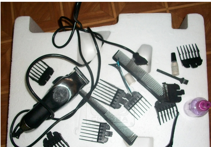
Materialen voor de kappersopleiding

In 2012 hebben wij de activiteiten van de afgelopen jaren; tuinieren, persoonlijke hygiëne, koken, naaien, kleden maken, huishoudelijke activiteiten, agrarische activiteiten, dierhouderij, computerles en handwerken voortgezet. De kappersopleiding is onze nieuwste activiteit binnen Marianne Center en erg gewild onder de vrouwelijke studenten.