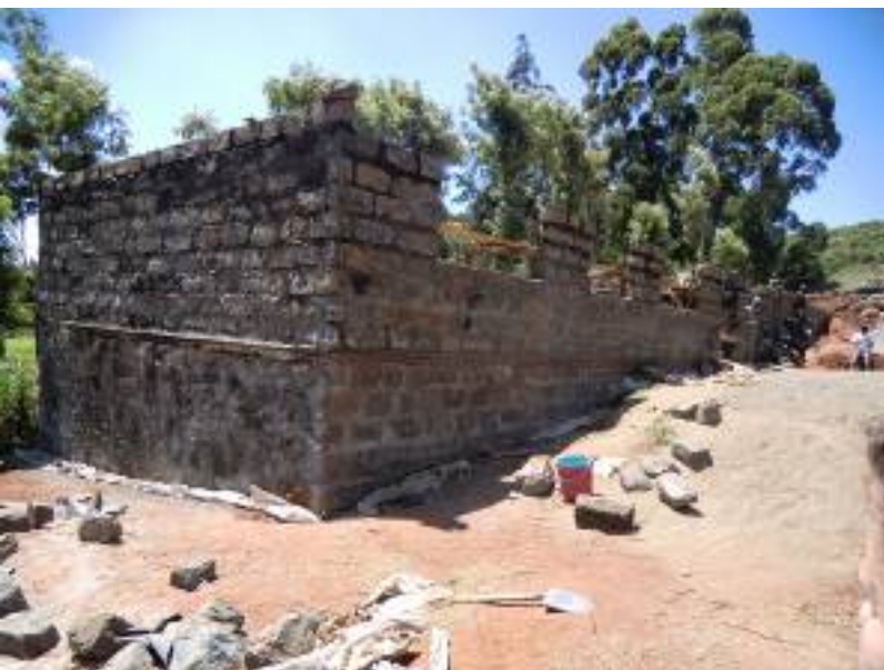
Muren van de slaapzaal