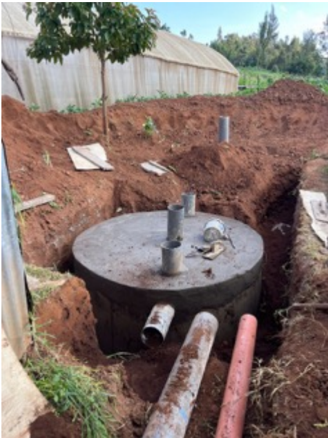
Biovergister is bijna klaar

Dit systeem is veel efficiënter en vereist een kleinere installatieruimte, verteert eventuele schadelijke bacteriën en zuivert het afvalwater voor hergebruik. Het afvalwater kan dan gebruikt worden voor onze gewassen.