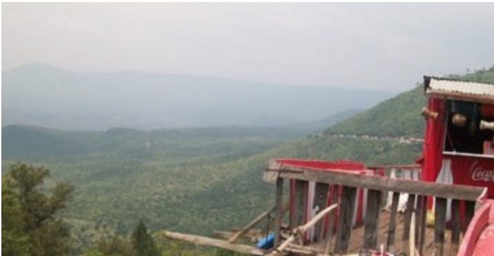
Great Rift Valley View Point

De wandelingen zijn ook een vorm van fysiotherapie, wat belangrijk is voor onze studenten die naast hun verstandelijke beperking ook vaak lichamelijke problemen hebben. Wandelen helpt hen om hun spieren sterker te maken maar ook om geestelijk tot rust te komen. De studenten krijgen tijdens de wandelingen verschillende omgevingen te zien, die anders zijn dan wat zij gewend zijn. Vaak komen ze langs boerengrond en kunnen dan met eigen ogen zien hoe deze grond wordt gebruikt. Op deze manier leren ze meer over land- en tuinbouw. Daarnaast leren wij de studenten de diverse boom- en vogelsoorten die wij tegenkomen tijdens de wandeling. Ook willen wij dat zij bewuster omgaan met het milieu en de natuur leren waarderen. Deze wandelingen dragen hieraan bij.