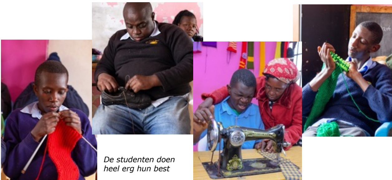
De studenten doen heel erg hun best

Tijdens de vakantieperiodes gaan onze leraren op huisbezoek bij de studenten, om te zien hoe de thuissituatie is en of de studenten alles wat ze hebben geleerd op het Marianne Center in praktijk kunnen brengen. Waar nodig wordt er ook ondersteuning verleend voor de implementatie van de kennis van de studenten aan de ouders. Ouders worden actief betrokken bij het werk om te ontdekken wat hun kinderen leren, zodat ze dat ook in de thuissituatie in praktijk kunnen brengen. Komend jaar zullen wij een ouderraad oprichten, om het makkelijker te maken voor ouders hun mening te delen en ideeën aan te leveren. De samenwerking en steun van ouders is ontzettend belangrijk voor ons.