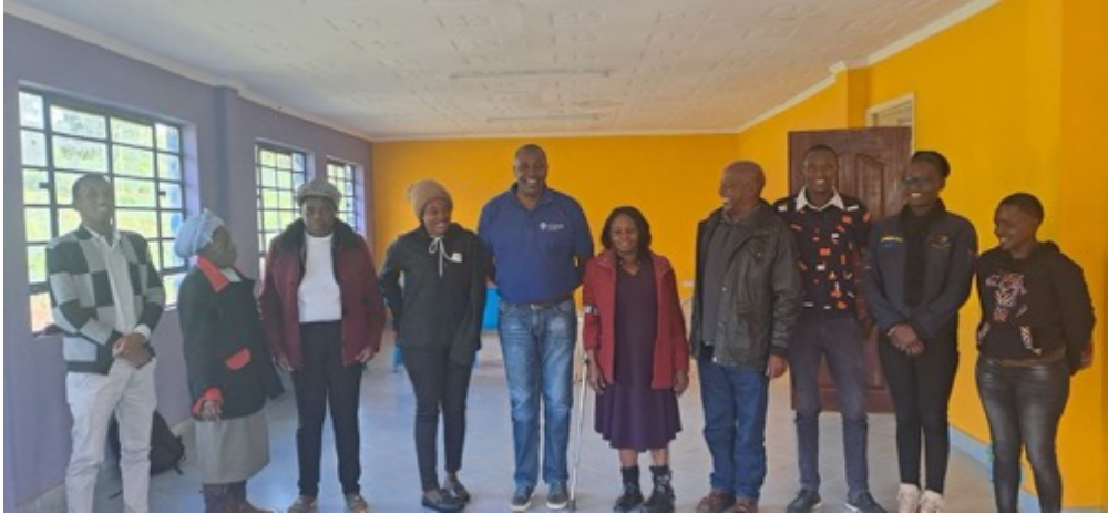
Ons personeel en manager

In 2023 hadden wij 9 personeelsleden waarvan 5 leerkrachten. Het is van belang om ons personeel gerichte trainingen aan te bieden, zodat wij optimale zorg en educatie kunnen verschaffen. In 2023 vond er zo'n training plaats. De training werd gegeven door het Kenyan Institute for Special Education (KISE). Begin 2024 zullen wij weer een training aanbieden aan ons personeel. Deze training wordt gefinancierd door Wilde Ganzen en andere stichtingen.