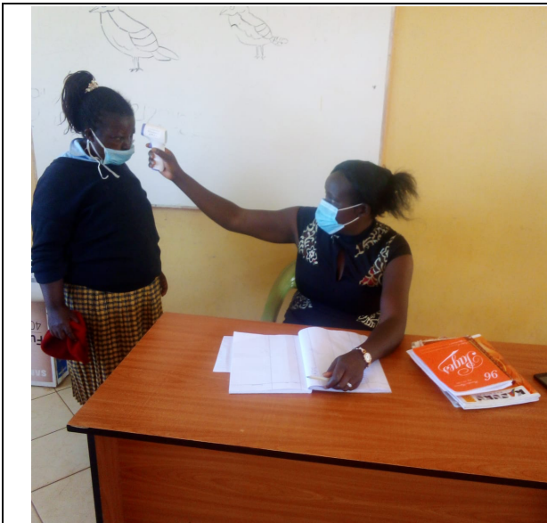
Covid maatregelen bij MC