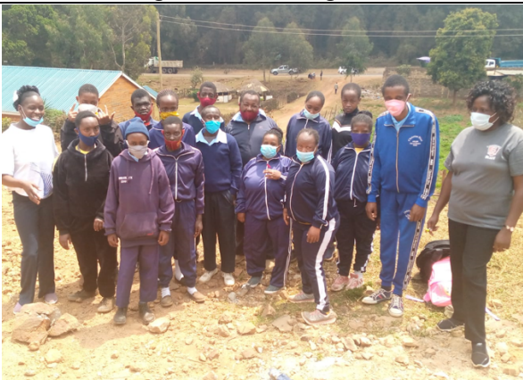
Onze studenten en leerleren