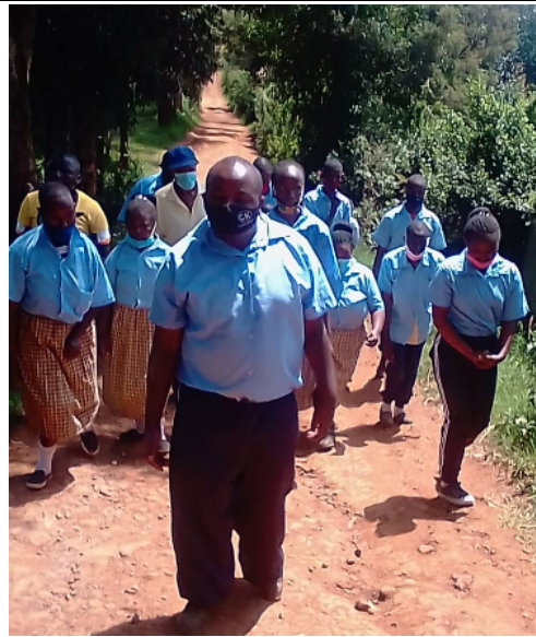
Wandelingen met de studenten