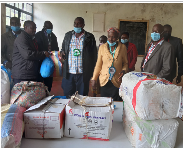
Donaties aan Marianne Center