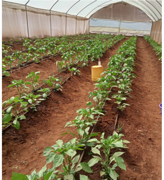
Verbouwen van gewassen in onze gerenoveerde kas