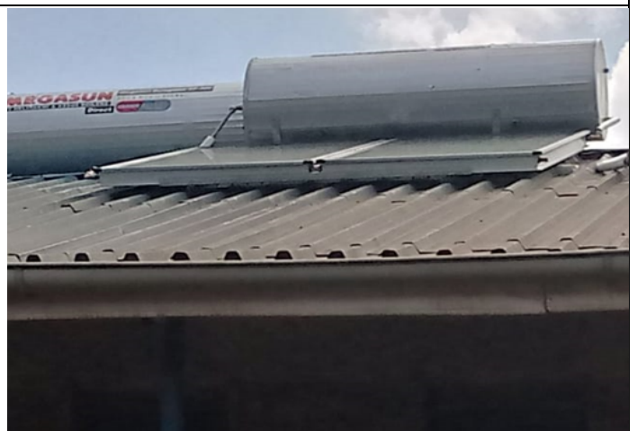
Zonneboilers geplaatst door Our Energy Foundation