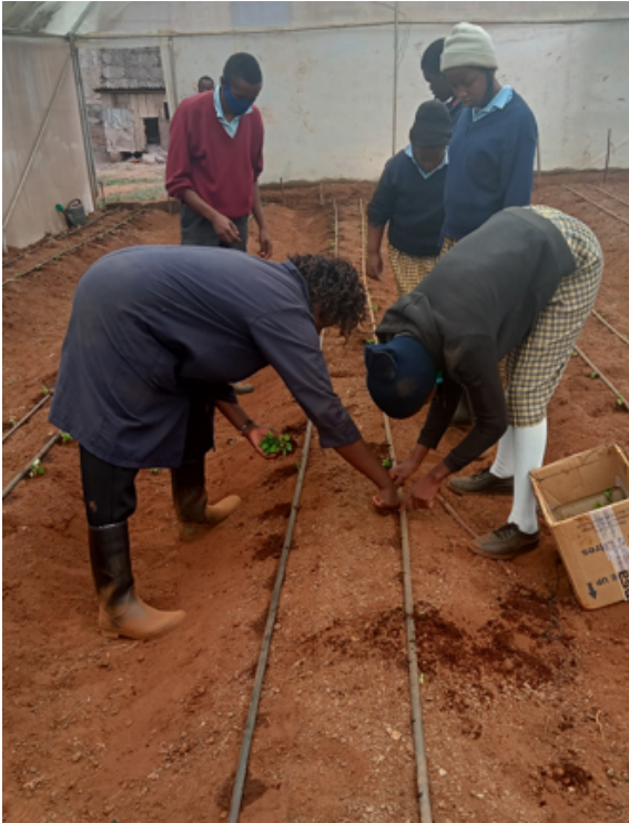
Verbouwen van gewassen in onze gerenoveerde kas