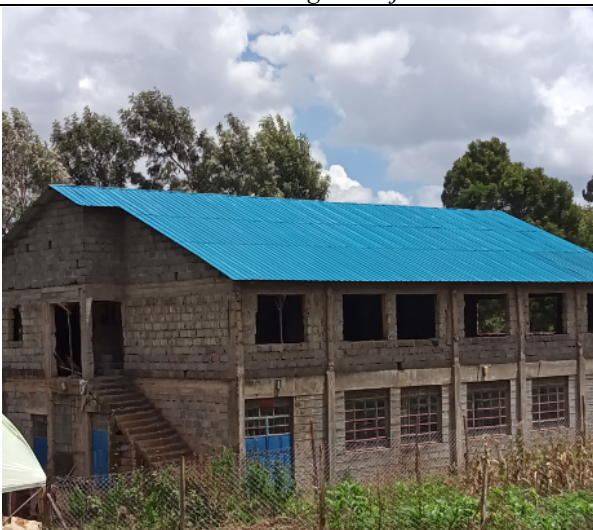
Het dak zit erop van het keuken- en administratiegebouw