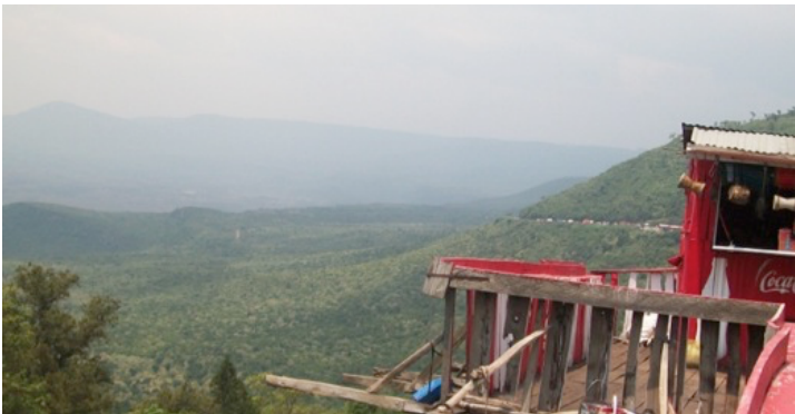
Great Rift Valley View Point

De wandelingen zijn ook een vorm van fysiotherapie, wat belangrijk is voor onze studenten die naast hun verstandelijke beperking ook vaak lichamelijke problemen hebben. Wandelen helpt hen om hun spieren sterker te maken maar ook om geestelijk tot rust te komen. De studenten krijgen tijdens de wandelingen verschillende omgevingen te zien, die anders zijn dan wat zij gewend zijn. Vaak komen ze langs boerengrond en kunnen dan met eigen ogen zien hoe deze grond wordt gebruikt. Op deze manier leren ze meer over land- en tuinbouw. Daarnaast leren wij de studenten de diverse boom- en vogelsoorten die wij tegenkomen tijdens de wandeling. Ook willen wij dat zij bewuster omgaan met het milieu en de natuur leren waarderen. Deze wandelingen dragen hieraan bij.